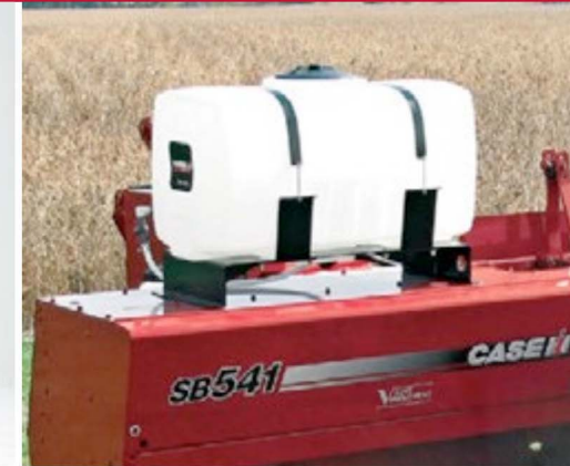
OTROS KITS POPULARES

Se puede agregar convenientemente un kit de extensión de la cámara de compresión a los modelos SB531 y SB541. En el caso de la empacadora SB541C ya está alargado. Esta longitud adicional mantiene el control de la paca por más tiempo para lograr una forma y densidad sobresalientes y consistentes, independientemente de las condiciones del cultivo. Recomendado cuando se usa la rampa de pacas de un cuarto de vuelta.