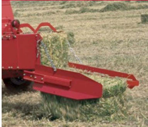
RAMPA PARA DESCARGA

Las temporadas de henificación son cortas y críticas. Debe cortar el heno cuando hay buen tiempo, colocar el heno de la mejor calidad posible y usar el mejor equipo para hacer ambas cosas. Personalice su empacadora con kits que pueden aumentar su productividad, y ahorrarle tiempo y dinero