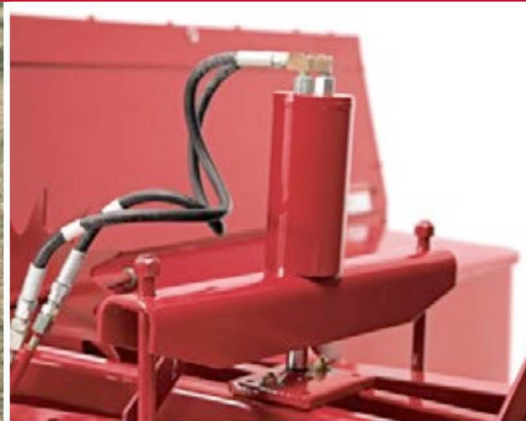
KIT DE TENSIÓN HIDRAFORMÁTICA PARA PACAS

La rampa de pacas de un cuarto de giro deja caer las pacas de lado para recogerlas con un remolque. Esta posición también mantiene el cordel fuera del suelo para evitar el deterioro por humedad.