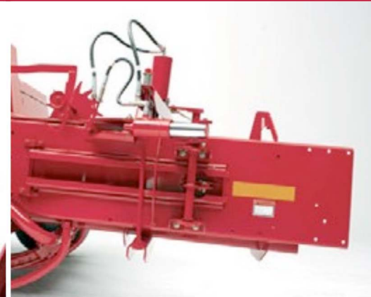
KIT DE EXTENSIÓN DE LA CAMARA DE COMPRESIÓN.

Se puede agregar un kit hidráulico de tensión de pacas a las empacadoras SB531 (estándar en SB541, SB541C & 551). Este kit proporciona una tensión de paca controlada hidráulicamente para obtener una paca de forma y densidad uniforme en diferentes condiciones de cultivo.